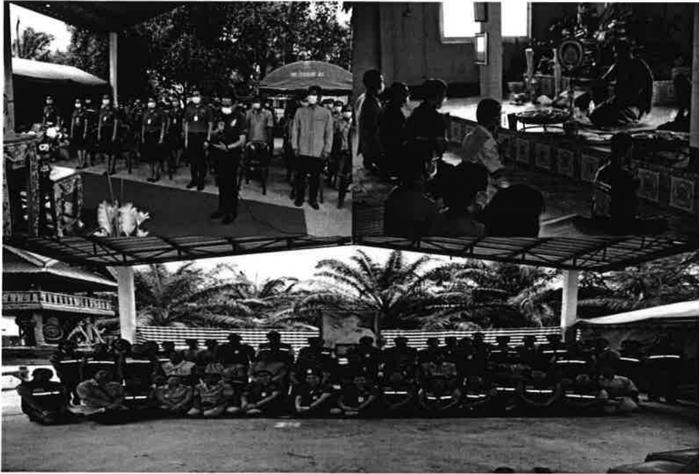
๓) กิจกรรมมอบดอกไม้เพื่อเป็นขวัญและกำลังใจแก่ เจ้าหน้าที่ที่ไปช่วยปฏิบัติราชการที่โรงพยาบาลสนามชวงโควิด